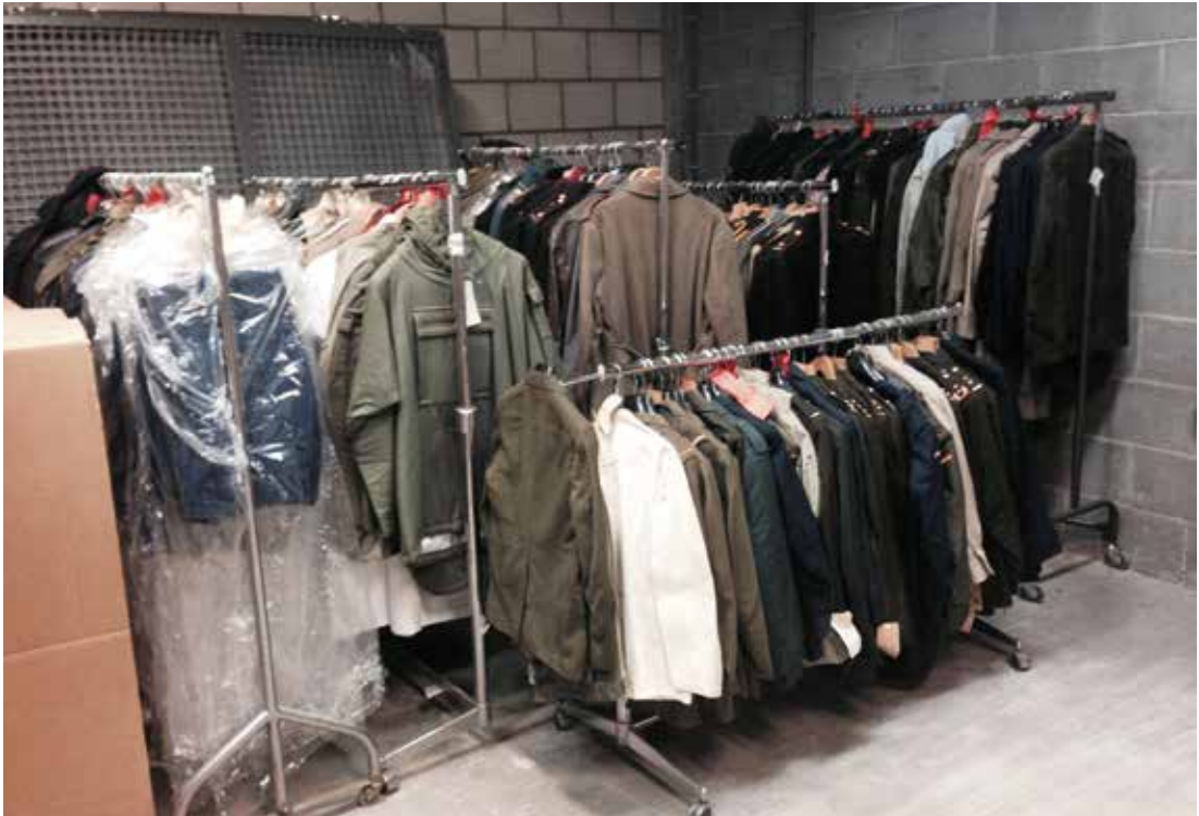
Bulkafstoting uit collectie Nationaal Militair Museum Soesterberg, kijkdagen voor musea in Mobilisatiecomplex Defensie te Lopik, september 2014.