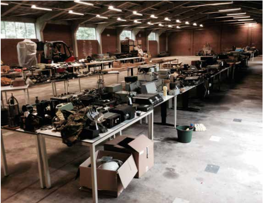
Bulkafstoting uit collectie Nationaal Militair Museum Soesterberg, kijkdagen voor musea in Mobilisatiecomplex Defensie te Lopik, september 2014.

‘De inrichting van een grotere afstotingsoperatie verdient een projectmatige aanpak.’